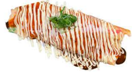
コチュジャンマヨ