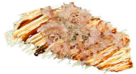
ソースマヨ(おみ焼き)