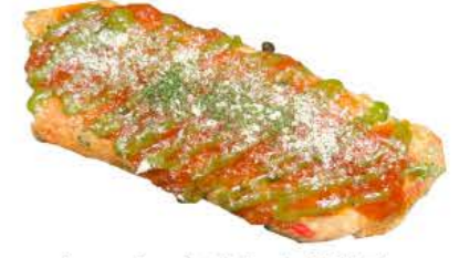
トマトバジル(ピザ風)