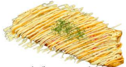
ダブルチーズマヨ